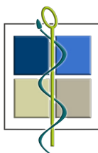
Conférence des Doyens

Conférence des Doyens • SANTÉ des facultés de Médecine • FORMATION RECHERCHE