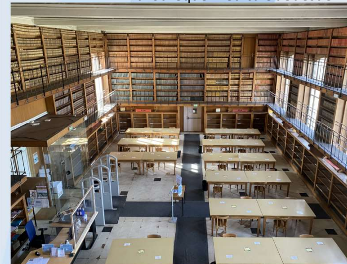
Bibliothèque médicale JGuesde ↴

Inscription individuelle (possible prise en charge par un organisme de formation continue) : 1200 €