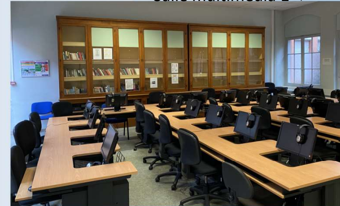
Salle multimédia 1 ↴

2 salles multimédia bibliothèque universitaire de J Guesde