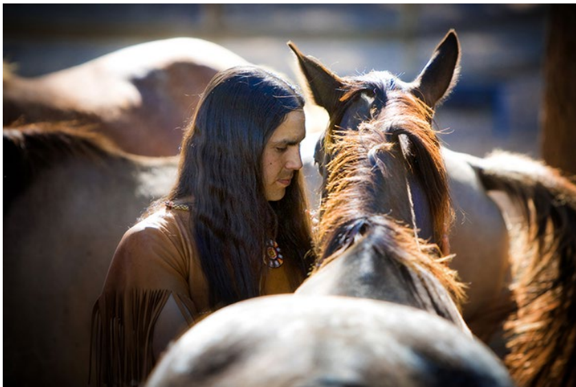
Un homme, “He Stalks One”, et un cheval créent un lien.

Ce travail a été soutenu par la National Science Foundation Collaborative Research Award (#1949305, #1949304, #1949305, et #1949283), les actions Marie Sklodowska Curie (programmes HOPE et MethylRIDE), le CNRS et l'Université Toulouse III - Paul Sabatier (Programme international de recherche AnimalFarm), l'Investissement d'avenir France Génomique (ANR-10-INBS-09), et le Conseil européen de la recherche (PEGASUS). Tous les protocoles de transmission des connaissances sacrées et traditionnelles ont été respectés, et les activités et résultats de la recherche ont été approuvés par un comité d'examen interne composé de dix gardiens des connaissances Lakota, qui font désormais partie du conseil d'administration de Taku Škaŋ Škaŋ Wasakliyapi : Global Institute for Traditional Sciences (GIFTS).