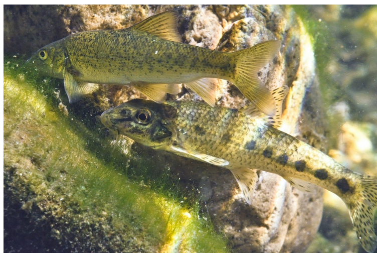
Figure 2 - Le barbeau (haut) et le goujon (bas) sont deux espèces de poissons se nourrissant sur le fond des cours d'eau et présentant les plus fortes contaminations en microplastiques.