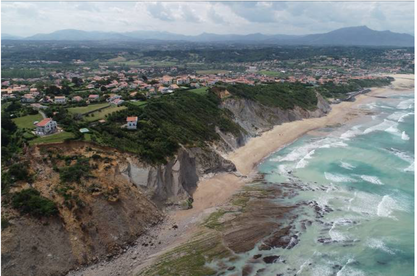
Vue aérienne de la falaise à Bidart (Côte Basque). Remarquer en bas à gauche de la photo, un pan de la falaise qui glisse vers la mer, phénomène caractéristique d'apport sédimentaire à l'océan