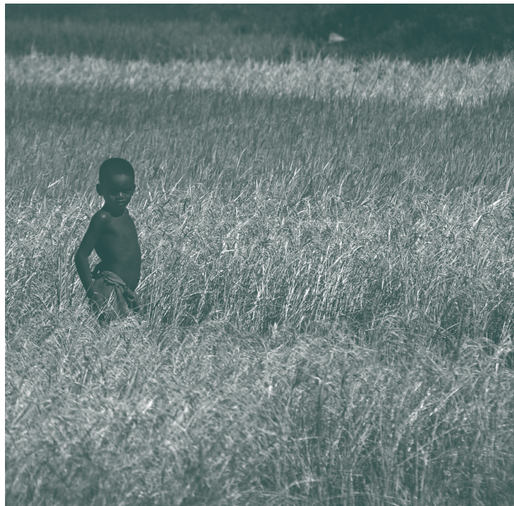
Exposition de photographies "Madagascar, l'île aux mille facettes". BU Sciences - Janvier 2009 - Association Androsace.