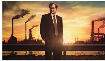
Mark Ruffalo dans Dark Waters

mère, il va découvrir que la campagne idyllique de son enfance est empoisonnée par une usine du puissant groupe chimique DuPont, premier employeur de la région."