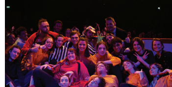
Les Ludiens prennent la pose dans la patinoire

La LUDI (Ligue Universitaire d'Improvisation) de Toulouse accueille deux ligues d'improvisation pour deux soirées exceptionnelles.