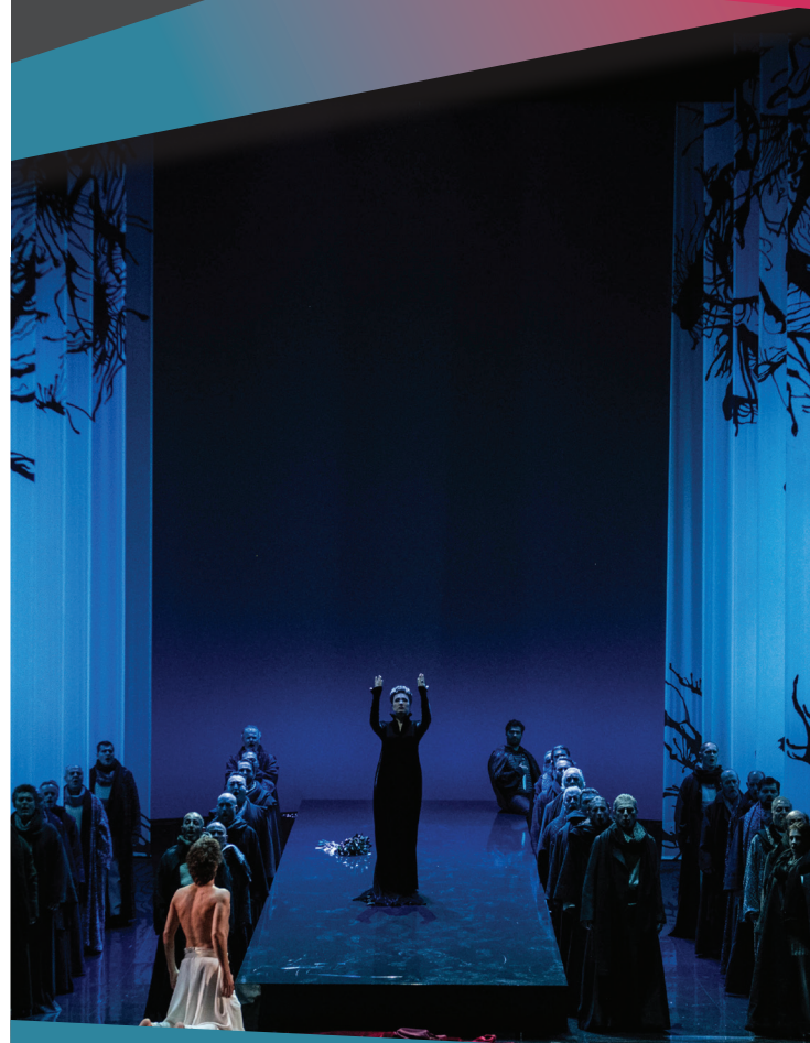
Marina Rebeka dans "Norma" de Vincenzo Bellini sur la scène de l'Opéra National du Capitole en 2019

"Univers'Capitole" Atelier de découvertes d'opéras pour les étudiantes et les étudiants