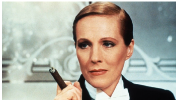
Julie Andrews dans Victor Victoria de Blake Edwards

Blake Edwards signe ici un remake flamboyant de la comédie musicale allemande "Viktor und Viktoria" de Reinhold Schunzel [1933]. Dans ce film, les tabous volent en éclats ! Blake Edwards utilise les armes de l'humour et du burlesque, la beauté de la musique et des ballets, pour traiter de sujets sérieux en toute légèreté.