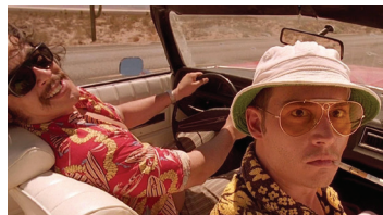
Benicio del Toro et Johnny Depp dans Las Vegas Parano

Ce ciné-débat est proposé dans le cadre de "La parenthèse psychédélique" (cf. page intérieure)