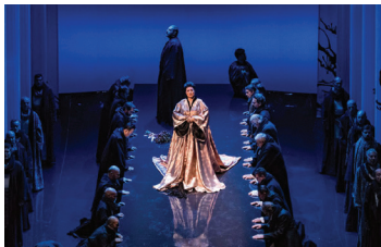
Norma - Opéra National du Capitole

Cette tragédie lyrique en deux actes, sur un livret de Felice Romani, est créé le 26 décembre 1831 au Teatro alla Scala de Milan.