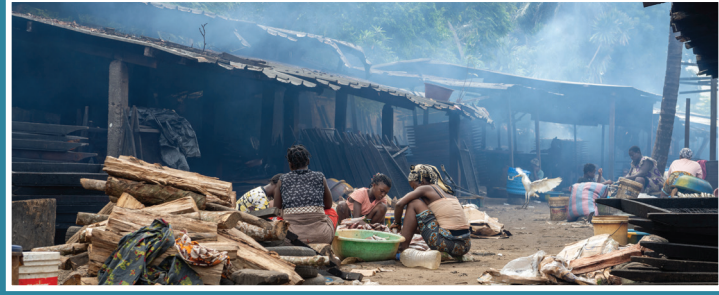
Dans la commune de Yopougon

Le projet de recherche ANR APIMAMA (Air Pollution Mitigation Actions for Megacities in Africa) vise à chercher des solutions pour réduire la pollution de l'air et les risques sanitaires et sociaux dans les villes africaines.