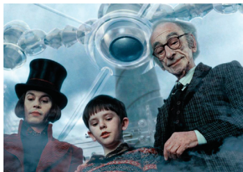
Johnny Depp, Freddie Highmore et David Kelly

«Les temps sont durs pour la famille Bucket, qui vit entassée dans une vieille maison à l'ombre de l'usine à sucreries de Willy Wonka. A la veille de son anniversaire, le jeune Charlie apprend l'organisation d'un concours dont le prix serait un séjour aux côtés de Willy Wonka pour visiter sa chocolaterie.»