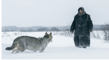
James Norton dans L'ombre de Staline (2019)

pour correspondants étrangers...» Inspiré d'une histoire vraie, ce film lève le voile sur une tragédie historique longtemps occultée et plus tard nommée Holodomor.