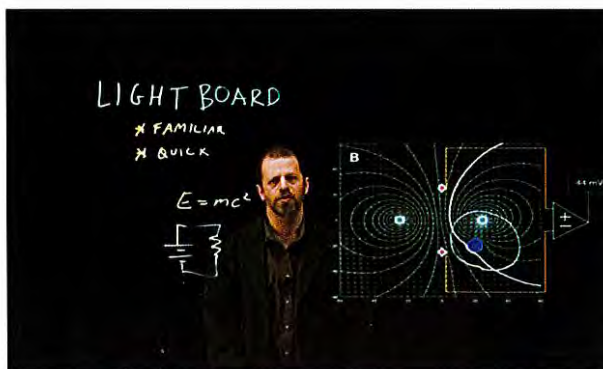
Figure 1 - Démonstration de lightboard

Le département de Chimie a pour projet d'acquérir des équipements de type lightboard. Ces outils s'appuieront sur les équipements de captation vidéo et sur les compétences (technicien audiovisuel) dont l'IUT s'est doté depuis plusieurs années.