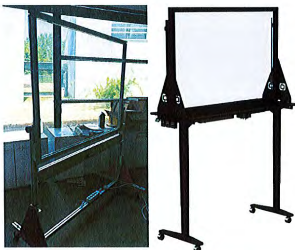
Figure 2 - Prototype réalisé et exemple de produit commerciaux

Le département a réalisé il y a maintenant un an un prototype de Lightboard qui a permis de valider le concept. Il souhaite maintenant se doter d'équipements commerciaux afin d'en faciliter l'accès à toute la communauté et à pallier les défauts constatés sur son prototype.